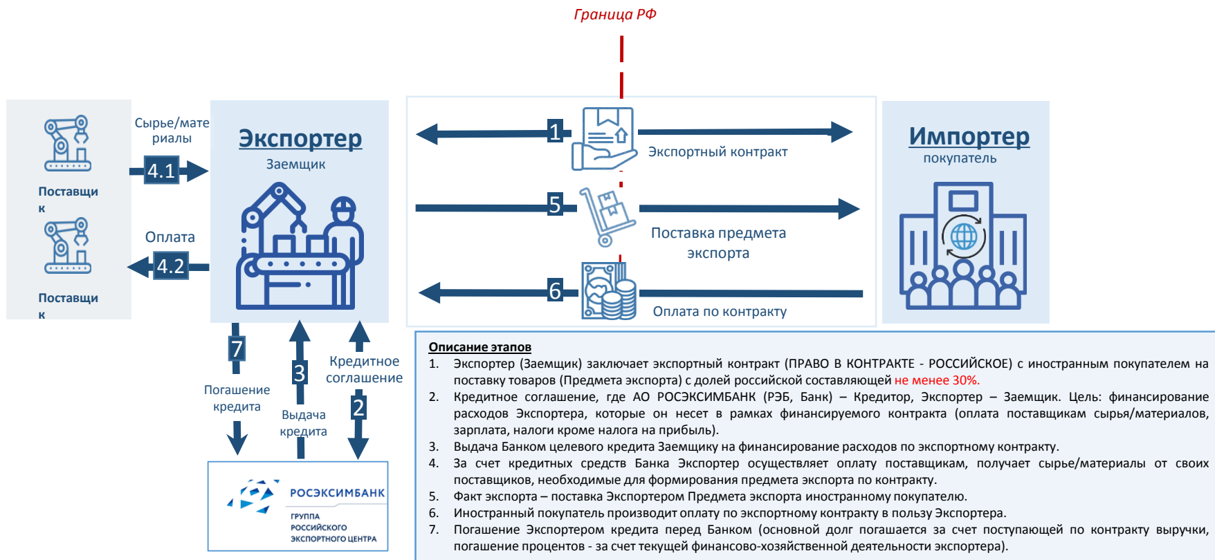
Схема организации финансирования