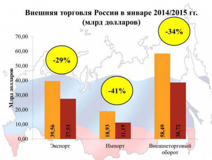
Рис. 2 Динамика экспорта и импорта за период января 2014-2015 гг.

Поскольку государство на данный момент активно применяет различные способы стимулирования экспорта, включая сокращение налоговой нагрузки, внешнеэкономическая деятельность становится привлекательной для инвесторов, и, возможно, объёмы