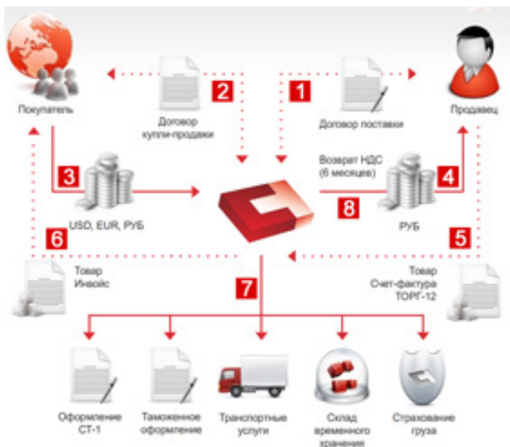
Рис. 4. Примерная схема экспортной сделки

копии транспортных, товаросопроводительных и (или) иных документов с отметками таможенных органов мест убытия, подтверждающих вывоз товаров за пределы территории РФ с учетом особенностей, предусмотренных подпунктом 4 пункта 1 статьи 165 Налогового кодекса.