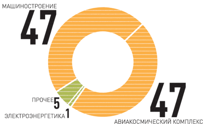
Рис. 1 Отраслевая структура государственной поддержки экспорта