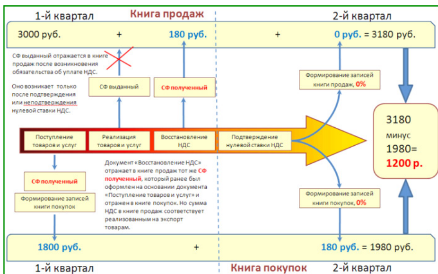
Рис. 5 Порядок формирования книги покупок и книги продаж при расчёте НДС

России разработать формат реестра и порядок его представления (п. 11 ст. 1 Закона 452-ФЗ). Кроме того, вводится электронный обмен сведениями о вывозе и ввозе товаров между ФТС и ФНС. Это позволит в кратчайшие сроки контролировать правомерность применения ставки НДС 0%. Поэтому бизнес может рассчитывать на более оперативное возмещение налога, что важно, в частности, субъектам малого и среднего предпринимательства с минимальным наличием собственных средств.