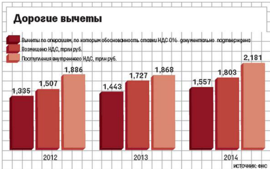
Рис. 3. Динамика налоговых вычетов по НДС в части применения нулевой ставки за период 2012-2014 гг.